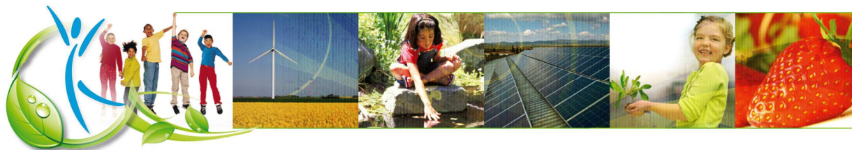
TABLEAU DE BORD « Création de l'Agenda »